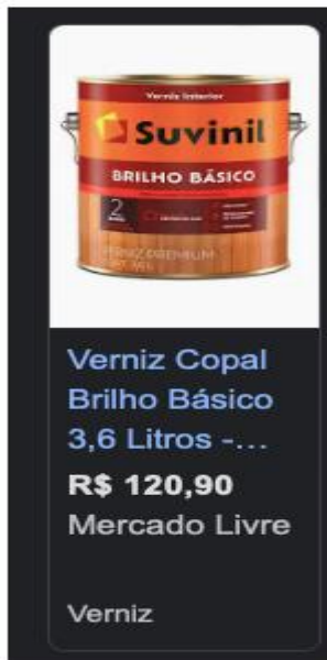
IMAGEM 02; item que é solicitado no Memorial Descritivo

Imagem 01: item que será pago conforme descrição da P.O, conforme tabela SINAPI