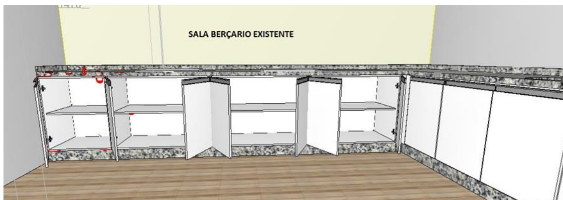
ANEXO II- FOTOS DAS BANCADAS EXISTENTES