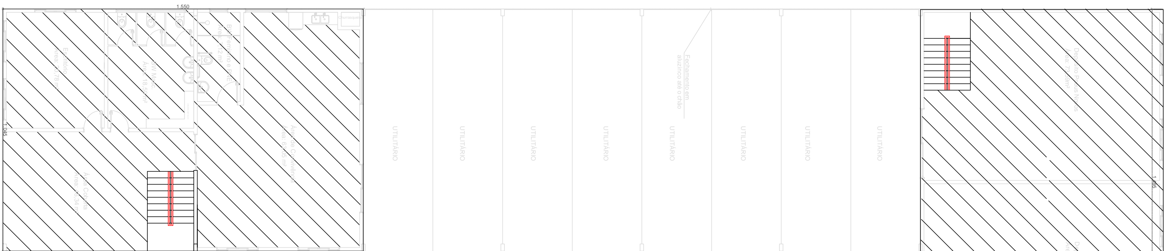
PLANTA BAIXA 1° ANDAR ÁREA: 318,3m² ESC: 1/100