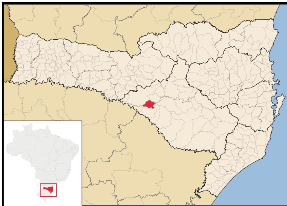
Figura 4.1 – Localização do município de Abdon Batista dentro do Estado de Santa Catarina.

Abdon Batista faz limites ao Norte com os municípios de Vargem e Campos Novos; ao Sul com Anita Garibaldi; ao Leste com Cerro Negro e a Oeste com São José do Cerrito, conforme é ilustrado na Figura 4.2.