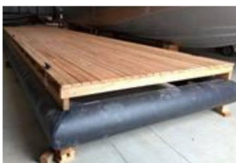
Imagens de píer e montagem.